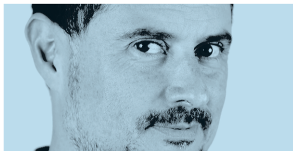
PER PAU MIRANDA @pauemail

La guerra afganesa està lluny d'acabar tot i el pacte entre Washington i els talibans, que ara tenen més fàcil tornar a imposar els seus postulats d'ultraortodòxia islamista sobre una població exhausta i mancada d'esperances